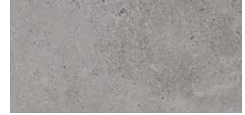
Berna Acero PORCELANOSA