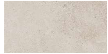
Berna Caliza PORCELANOSA

The rectangular large format tiles enhance spaciousness in every room.