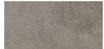
Berna Topo PORCELANOSA