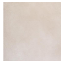
Evolution Beige 60x60