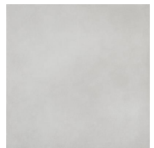
Evolution White 60x60