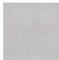
BlueStone BONE 80x80 cm