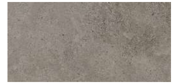
Berna Topo PORCELANOSA