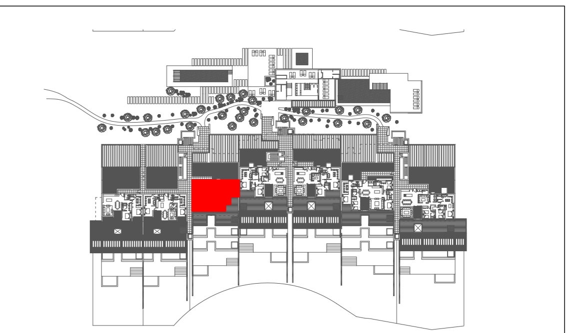
SITUACION POR BLOQUE